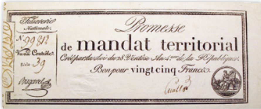
Kuva 2. 25 frangin mandat territorial vuodelta 1796.

nolla kuivua ennen kiertoon päätymistä. Vasta tällöin Ranskan ajautui inflaation kouriin. Tätä tietoa tukevat vallankumouksen aikaisissa sanomalehdissä säilyneet hintatiedot ja hyperinflaatio iski vasta vuonna 1795. 8 Viimeisenä virheenä voidaan pitää toukokuusta 1793 joulukuun 1794 loppuun asti voimassa ollutta hintakontrollia ( terreur économique ), joka asetti tuotteille maksimihinnat.