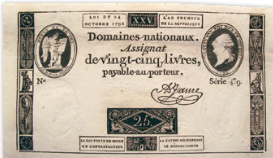
Kuva 8. 25 livren seteli vuodelta 1792. Viimeinen assignaatti, jossa Ludvig XVI esiintyy.

Taws, Richard. 'The Currency of Caricature in Revolutionary France' in The Efflorescence of Caricature, 1715-1838 , toim. Todd Porterfield, 2011. s. 95-115.