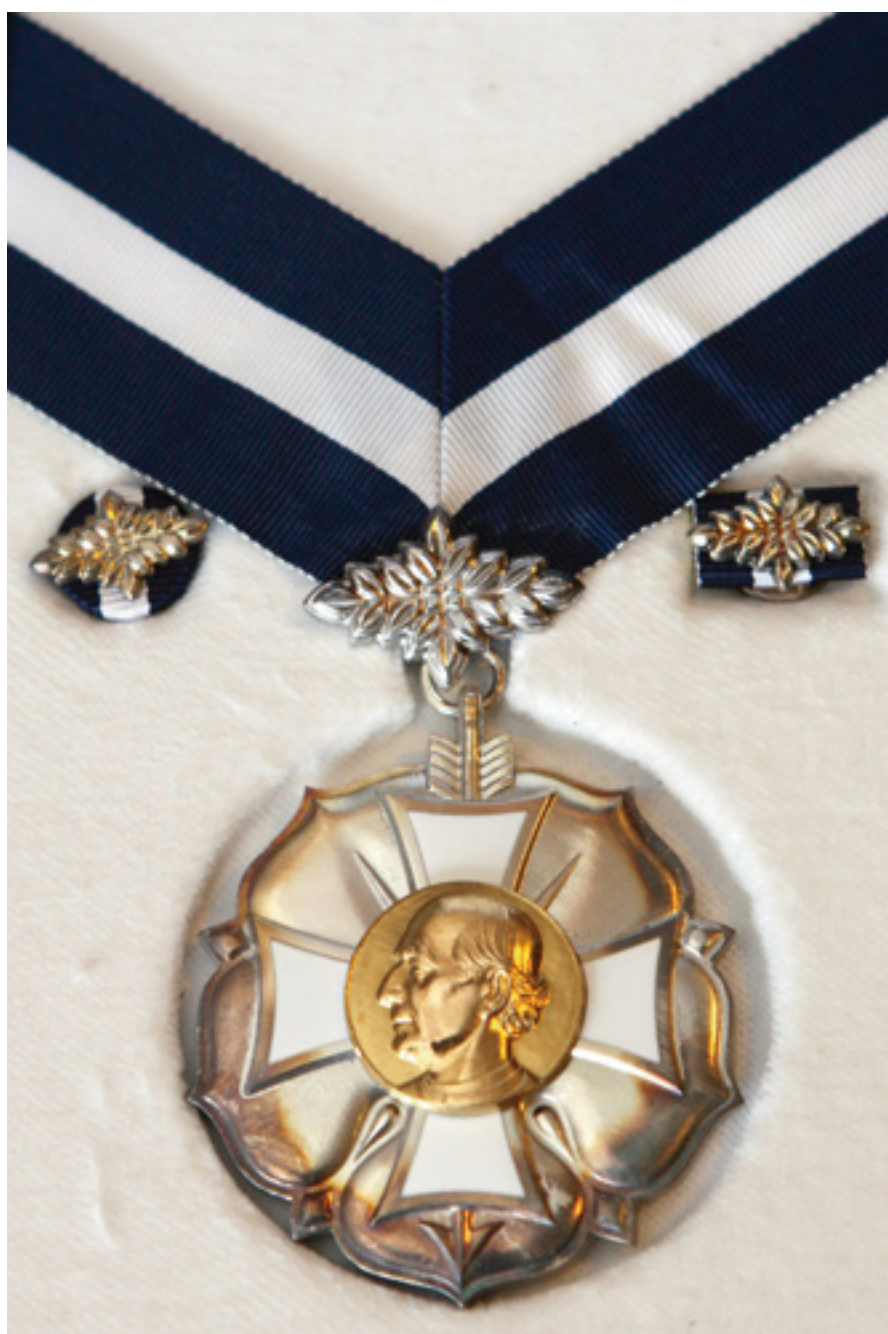
3. Ritarikunnan 3. luokka