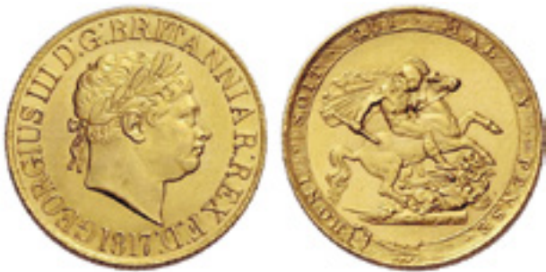
Englannin kultainen sovereign ensimmäiseltä lyöntivuodelta 1817. Arvo noin 500–800 EUR.

d) Englanti otti virallisesti käyttöön kultakannan luopuen kaksimetallikannasta vuonna 1816 johtuen Napoleonin sotien aikaansaamasta epävakauudesta. Rahaoloihin haluttiin vakautta. Rahajärjestelmän teoreettinen perusta oli kultainen guinea, joka vastasi 21 shillinkiä. Vuonna 1817 tuli käyttöön kultaraha sovereign (= punta = 20 shillinkiä), joka sisälsi 113 grainia eli 7,32228 grammaa puhdasta kultaa.