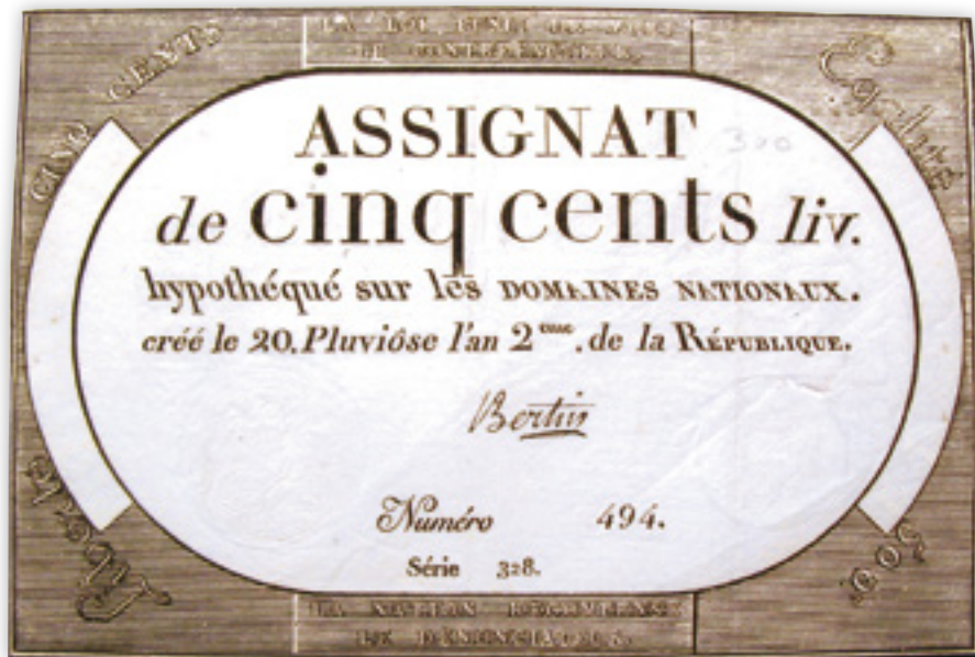
Kuva 5. 500 livren assignaatti vuodelta 1794. Kyseisessä setelissä on 8 piilopistettä.

tekijät olleet tekniikaltaan väärentäjien ulottumattomissa. Tämä tulee ilmi tekstistä: "la loi punit de mort le contrefacteur / la nation récompense le dénonciateur" (suom. Laki rankaisee väärentäjää kuolemantuomilla / Valtio palkitsee ilmiantajan). Sisältönsä vuoksi nämä voidaan laskea turvatekijöiksi, sillä giljotiinin kultakaudella uhkaus oli syytä ottaa todesta. Vallankumouksen lop-