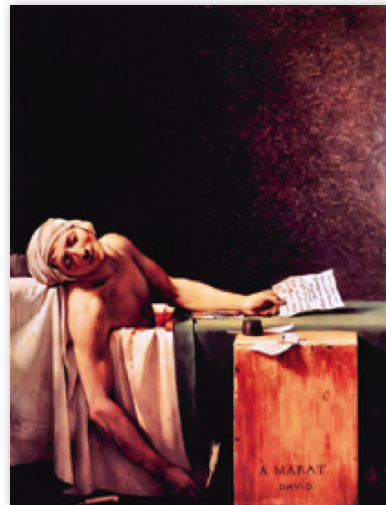
Kuva 3. Marat'n kuolema. Jacques-Louis David, 1793. Öljy kankaalle. Royal Museums of Fine Arts of Belgium.

Assignaattit painettiin vesileimalliselle paperille, joka oli yksilöity jokaiselle setelityypille omanlaisekseen, vaikka joissain tyypeissä esiintyy useammanlaisia vesileimoja 13 . Turvallisuustekijöinä vesileiman lisäksi käytettiin ns. piilopisteitä, joiden tarkoitus oli harhauttaa väärentäjiä (kuva 5). Tämän ohella käytettiin puristeleimoja, jotka tosin kuuluivat nopeasti kierrossa (kuva 6). Aikalaiset olivat tietoisia, etteivät käytössä olleet turvallisuus-