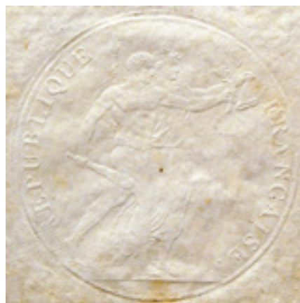
Kuva 6. Yksityiskohta valokuvan 1 setelin puristelemasta.

tekijät olleet tekniikaltaan väärentäjien ulottumattomissa. Tämä tulee ilmi tekstistä: "la loi punit de mort le contrefacteur / la nation récompense le dénonciateur" (suom. Laki rankaisee väärentäjää kuolemantuomilla / Valtio palkitsee ilmiantajan). Sisältönsä vuoksi nämä voidaan laskea turvatekijöiksi, sillä giljotiinin kultakaudella uhkaus oli syytä ottaa todesta. Vallankumouksen lop-