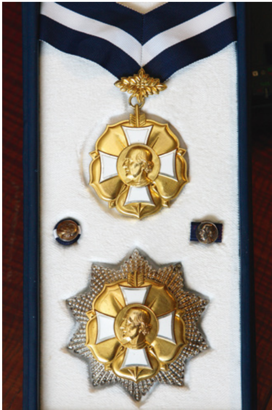
2. Ritarikunnan 2. luokka