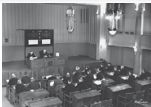
Pörssisali vuonna 1937. Sähkömekaaninen noteeraustaulu otettiin käyttöön vuonna 1935.

Suomen ensimmäinen varsinainen pörssi-istunto pidettiin 7.10.1912. Pörssitoiminnan juuret ovat Suomessa kuitenkin jo 1860-luvulla. Toiminta oli aluksi epä säännöllistä, osakkeilla ja muilla arvopapereilla käytiin kauppaa satunnaisissa epävirallisissa pörssi-huutokaupoissa. Säännöllinen ja järjestäytyneet pörssi-