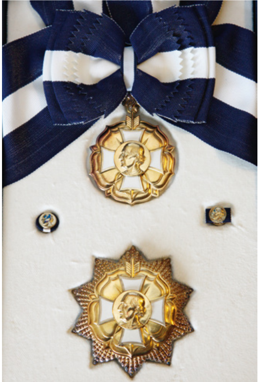
1. Ritarikunnan 1. luokka

Hlinkan aktiivinen poliittinen toiminta 2 ei kuitenkaan miellyttänyt viranomaisia eikä kirkkoa ja hänet erotettiin virastaan paikallisen piispan toimesta kesäkuussa 1906. Pidätys ja oikeudenkäynti seurasivat myöhemmin ja hän sai sakkojen lisäksi kahden vuoden vankeusrangaistuksen Unkarin vastaisesta kansankiihotuksesta. Lokakuussa 1907 Cernovan asukkaat pyysivät viran-