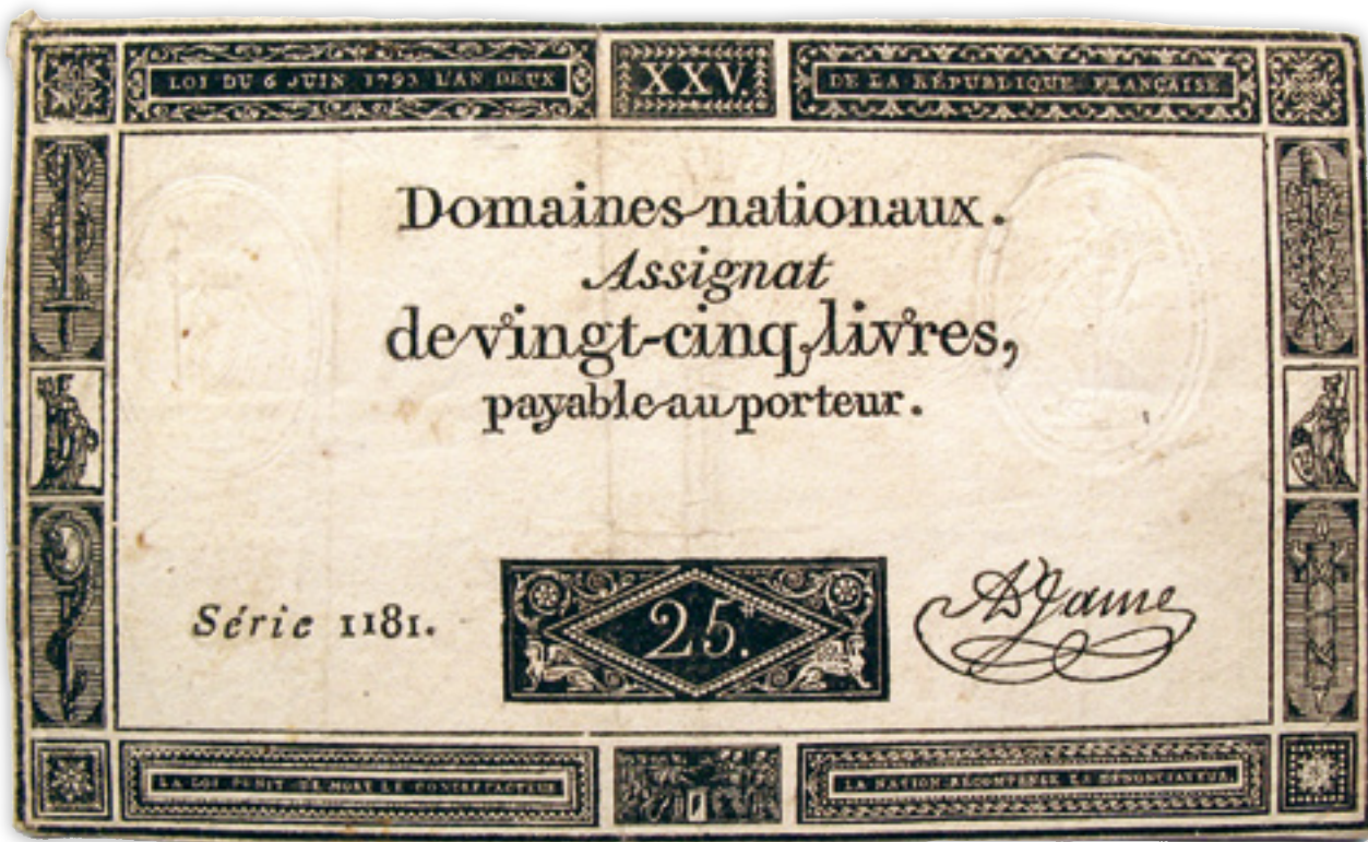
Kuva 9. 25 livren seteli vuoden 1793 alusta. Viittauksia kuninkaaseen ei enää löydy.