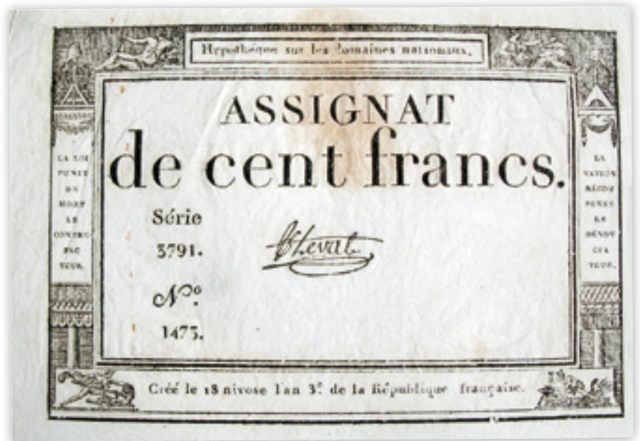
Kuva 1. 100 frangin assignaatti vuoden 1795 alusta.